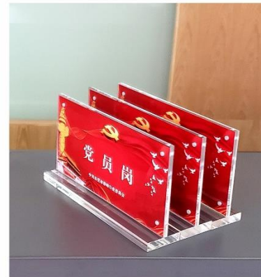
党员岗台牌实物图