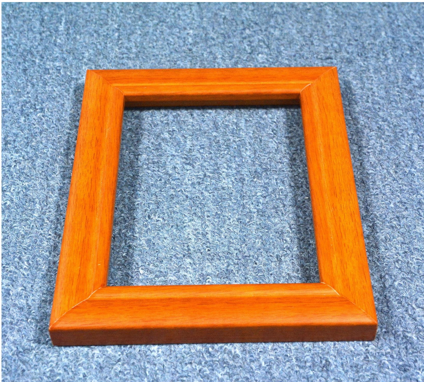
国产木框（原木胡桃色）